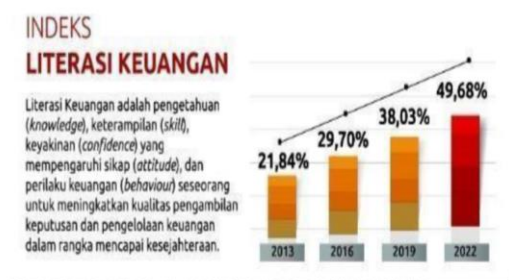
Gambar 1. Literasi Keuangan

Menurut Otoritas Jasa Keuangan (2022) , literasi keuangan adalah pengetahuan ( knowledge ), keterampilan ( skill ), dan keyakinan ( confidence ) yang mempengaruhi sikap ( attitude ) dan perilaku keuangan ( behaviour ) seseorang untuk meningkatkan kualitas pengambilan keputusan dan pengelolaan keuangan dalam rangka mencapai kesejahteraan. Literasi keuangan yaitu syarat wajib bagi setiap orang untuk menghindari masalah keuangan (Azizah, 2020). Literasi dapat diartikan kemampuan untuk memahami, jadi literasi keuangan ialah kemampuan untuk mengelola keuangan yang mereka miliki untuk mengembangkan hidup agar lebih berkualitas dimasa yang akan datang. Literasi keuangan adalah kemampuan tentang pengetahuan seseorang yang berkaitan dengan pengelolaan keuangannya, dan dengan kemampuan literasi keuangan seseorang akan berdampak pada peningkatan taraf hidup seseorang tersebut ( Sholeh, 2019 ).